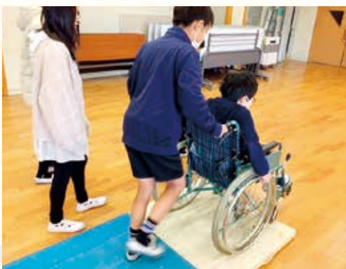
車いす体験の様子

また、学校に保管してある車いすを使用して、車いす体験を行いました。体験を通して、車いす操作や補助の仕方の難しさを実感し、援助には優しい声掛けや思いやりが大切だと知ることができました。また、車いすの方が危険、不便だと感じる道をVR映像で体験することで、町のバリアフリー化にも興味をもち、北方町内でバリアフリーが必要だと感じる場所を調べ、子どもたちで交流しました。