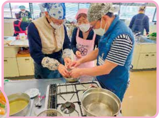
▲食材の扱い方を学びながら楽しく料理を