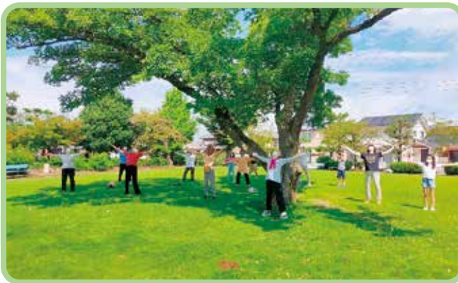
▲円鏡寺公園では毎回15名ほどの方が参加