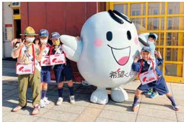
岐阜11団ボーイスカウト様による街頭募金活動の様子

戸別募金 2,214,700 円 法人募金 344,700 円 その他の募金 198,512 円