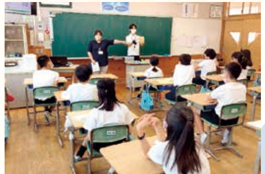
認知症について学ぶ様子

北方町役場健康推進課の地域包括支援センターの方を招き、認知症について学ぶ機会を設けました。認知症は脳の病気であること、認知症のさまざまな症状や周りのサポートの仕方について詳しく知ることができました。