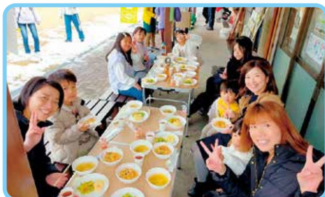
▲心温まる料理を一緒にいただきます!